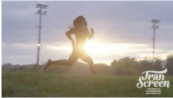
Changing the game