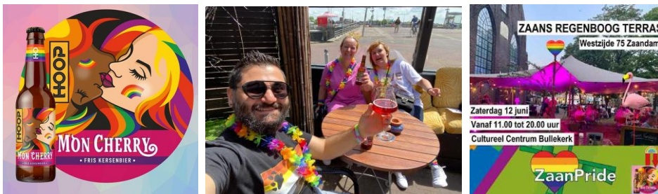
Zaans Regenboogbier drinken op één van de vele regenboogterrassen.

Het speciaal ter gelegenheid van ZaanPride gebrouwen Zaans Regenboogbier Mon Cherry van Brouwerij Hoop vond gretig aftrek. Al voorafgaand aan ZaanPride en tijdens de Zaanse regenboogweek op de zes regenboogterrassen bij Cartel, De Fabriek, Het Pand, Zaantheater, Teasers, CC Bullekerk en De Waterraaf Nauerna.