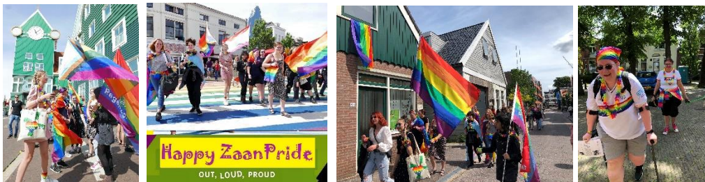
De Mini Pride Walk, voor het stadhuis, over het regenboogzebrapad, langs Bureau Discriminatiezaken en eindigend bij CC Bullekerk.

De wandeling van 20 km blijft te downloaden op de website van De Zaanse Regenboog, evenals de 2,5 km Mini Pride Walk door Zaandam met allerlei Zaanse LHBTIQ+ wetenswaardigheden.