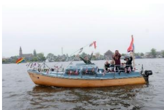
Tijdens de opening ook belangstelling vanaf het water!

De opening was in samenwerking met Vereniging de Zaansche Molen en Chardongay (wijn en cava).