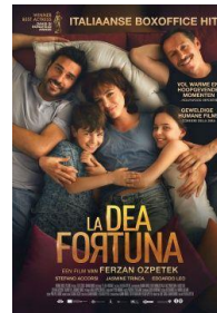
La Dea Fortuna