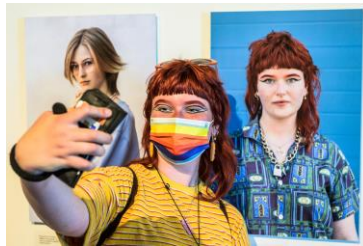
De Toekomst is Paars in Zaan Museum!