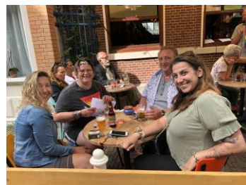
Sfeerplaatjes van de Zaanse Queer Pub Quiz.