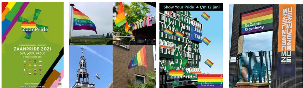
ZaanPride 2021 poster, regenboogvlaggen met linksonder de Zaanse Regenboogvlag op CC Bullekerk, de flyer 'Show your pride' en rechts Zaantheater.

Het is een prachtige en drukke week geweest. Een mooie week met veel goed bezocht activiteiten en een verrassend mooie opkomst bij de Mini Pride Walk. We hebben super veel mensen bereikt en meegekregen. Het was dus een week vol zichtbaarheid. Hieronder een overzicht van de activiteiten.