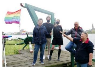
Proosten met een heerlijk glaasje Chardongay!