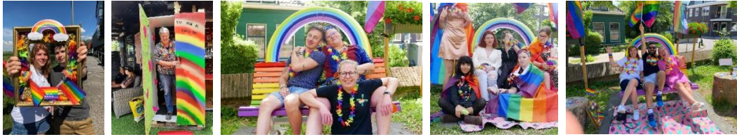
Fotobooth bij Zaantheater, Uit de kast bij Cartel & Fotobooth bij Terras Bullekerk.